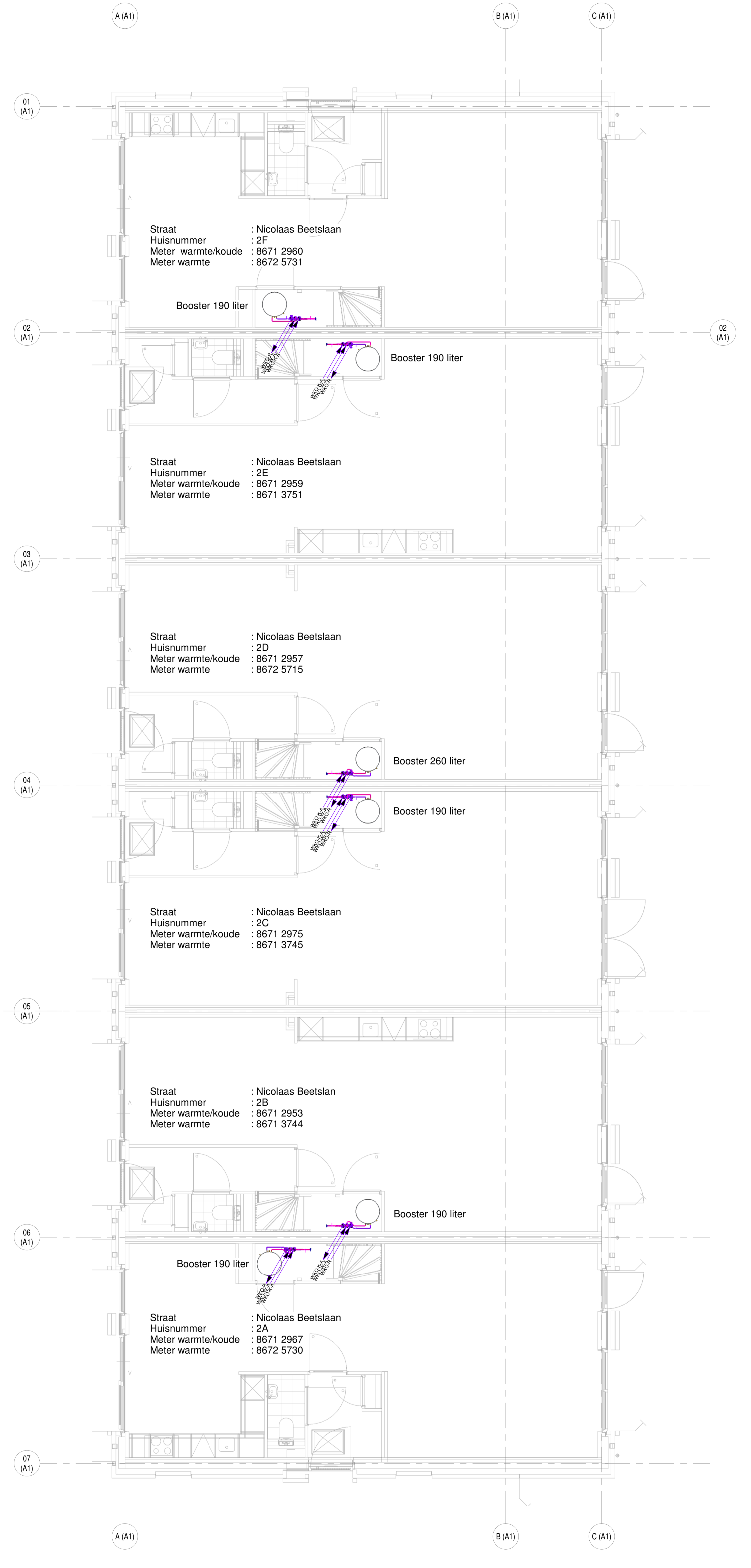
2 00 begane grond A1 1 : 50